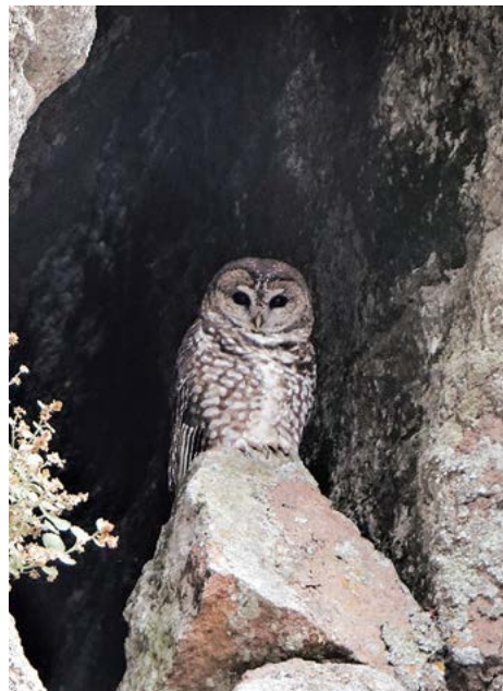
Figura 4. Sitio de descanso (cueva) de Strix occidentalis lucida en Sierra Fria, Aguascalientes.

Esta subespecie utiliza para alimentarse una diversidad de sitios, tales como los bosques manejados y no manejados, bosques de piñón-enebro ( Pinus cembroides-Juniperus spp.), bosques mixtos de coníferas ( Abies lasiocarpa , Pinus ponderosa , Acer spp., Abies concolor , Psuedotsuga menziesii , Pinus flexilis o Picea pungens ) y bosques de pino ponderosa ( Pinus ponderosa var. Scopulorum y arizonica ), así como, acantilados, terrazas y zonas ribereñas (Ganey et al., 2003; Willey y Van Riper,