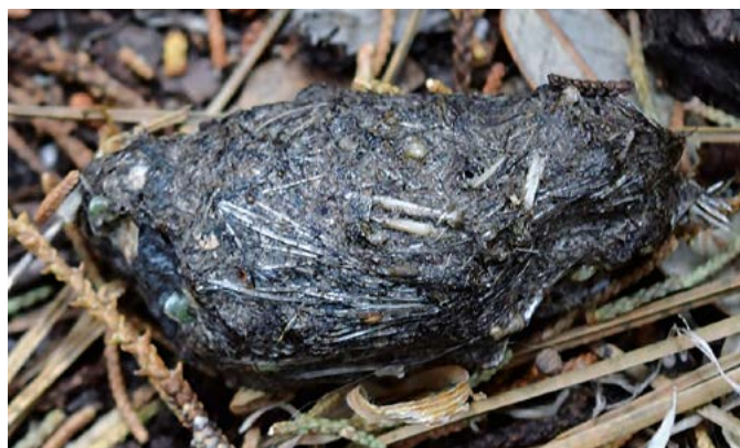
Figura 5. Egagrópila (regurgitación) de Strix occidentalis lucida conteniendo restos de sus presas, Sierra Fría, Aguascalientes.

AOU. 1983. Check-list of North American birds. 6ta edición. American Ornithologists Union. Washington, D.C. 691p. Barrows C.W. 1981. Roost selection by spotted owls: an adaptation to heat stress. Condor .83:302-309. Bravo V.M.G., Tarango A.L.A., Clemente S.F., Mendoza M.G.D. 2005. Mexican spotted owls ( Strix occidentalis lucida ) diet composition and variation at Valparaiso, Zacatecas, Mexico. Agrociencia , 39(5), 509-515. Chien Yu-Lan, Larson D.M. 2009. Valuing old growth forests and northern spotted owls: a supply-side option price approach. Handbook on Environmental Quality, Environmental Research Advances , 265-284. Dawson W.R., Ligon J.D., Murphy J.R., Myers J.P., Simberloff D., Verner J. 1987. Report of the scientific advisory panel on the spotted owl. Condor 89, 205-229. Forsman E.D. 1983. Methods and materials for locating and studying spotted owls. USDA Forest Service, General Technical Report,