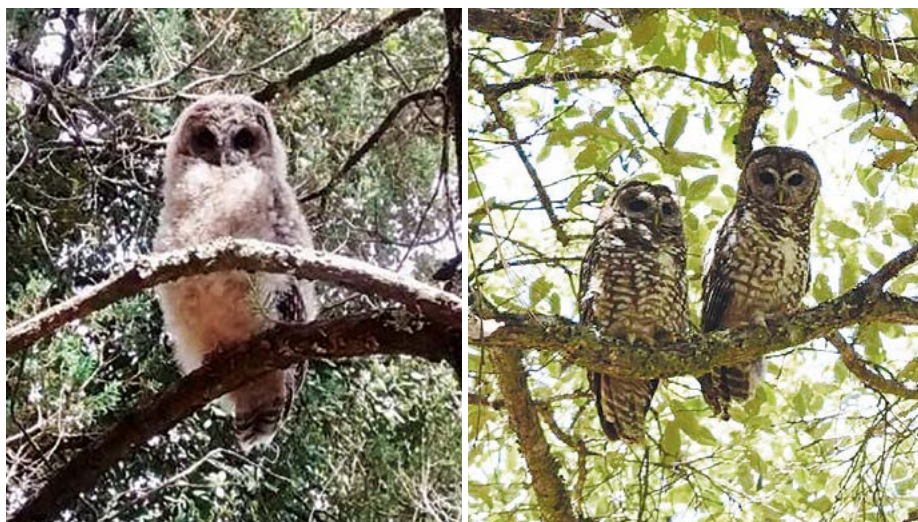
Figura 2. Polluelo (izquierda) y pareja de adultos (derecha) de Strix occidentalis lucida en Sierra Fría, Aguascalientes y Súchil, Durango, México (Fotografía de Mariana Jovita Silva Piña y del primer autor, respectivamente).

rango, Guanajuato, Jalisco, Michoacán, Nuevo León, San Luis Potosí, Sonora y Zacatecas (Figura 3) (U. S. Fish and Wildlife Service, 2012) ocupando montañas boscosas y cañones. La mayoría de los registros para S. occidentalis lucida han sido en la Sierra Madre Occidental (Rinkevich et al. , 1995).