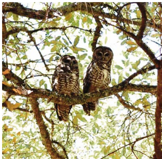
Figura 1. Pareja de adultos de Strix occidentalis lucida en el municipio de Súchil, Durango.

Strix occidentalis lucida se distribuye en los Estados Unidos de América en Colorado y Utah, Arizona, Nuevo México y Texas (Dawson et al. , 1987; Gutiérrez et al. , 1995). En México se le encuentra en la Sierra Madre Occidental, Sierra Madre Oriental y el Eje Neovolcánico Transversal abarcando los estados de Aguascalientes, Chihuahua, Coahuila, Colima, Du-